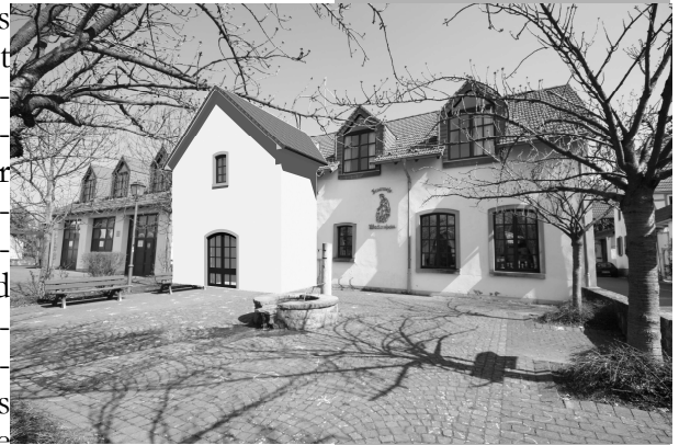
Anbau Dorfgemeinschaftshaus—Blick vom Dorfplatz

Der Beschluss war gefasst, der Baubeginn sollte im November erfolgen. Architekt und Statiker hatten sich ehrenamtlich eingebracht und alles Nötige geliefert, der Rohbau sollte noch vor dem Weihnachtsmarkt fertig sein. Aber das